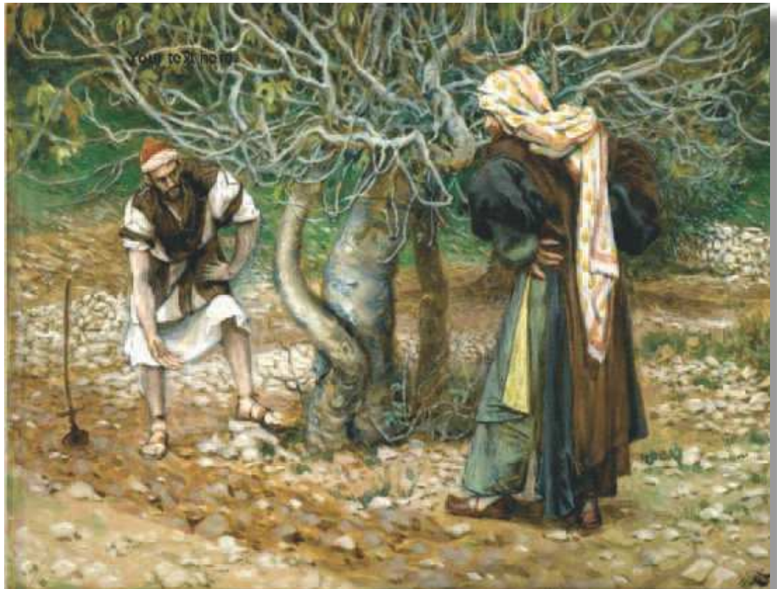
Viinitarhan hoitaja esittelee isännälle viikunapuuta.

Jeesuksen julkinen toiminta alkoi Hänen ollessaan ”noin kolmenkymmenen vuoden vanha”, Luukkaan mukaan. Julkisen toiminnan alku oli Johanneksen suorittama kaste. Tästä eteenpäin Jeesus toimi viinitarhan Herran viinitarhurina noin kolmen vuoden ajan. Hänen tehtävänsä oli keskittyä viikunapuun hoitoon. Viinitarhaan oli sen omistaja ottanut muitakin tarhureita. He olivat paikalla jo Jeesuksen saapuessa. Heille oli annettu selvät ohjeet: Jumalan Sana siitä, miten viikunapuu tuottaisi hedelmää esimerkiksi muille tarhan puille. Tarhurit olivat kuitenkin ryh-